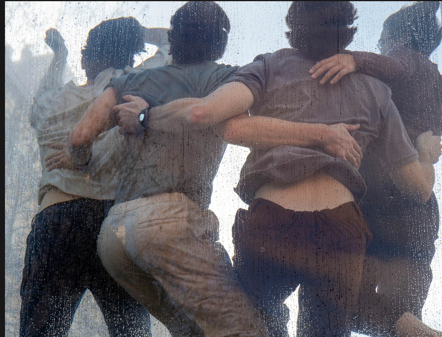
Men in the water, Marseille, Février 2025